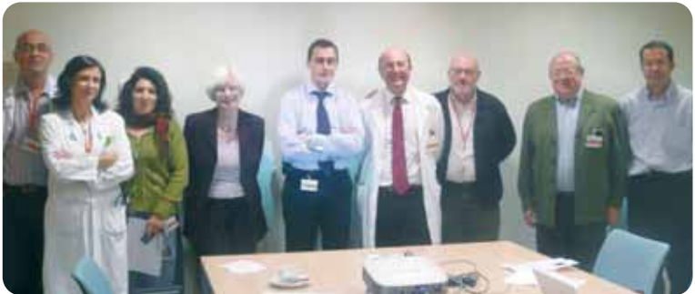
Imagen de reunión en el ICO.

Este centro cumple con los requisitos que ESMO marca para ser nombrado como referencia europea: el centro tiene integrado en el mismo servicio clínico oncología y cuidados paliativos, tiene la filosofía de no abandono al