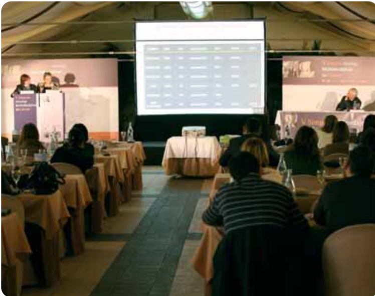
Panorámica de una sesión del Simposio.

Durante los pasados días 29 y 30 de enero de 2009 se celebró en Elche el V Simposio Abordaje Multidisciplinar del Cáncer, organizado por el Prof. Dr.