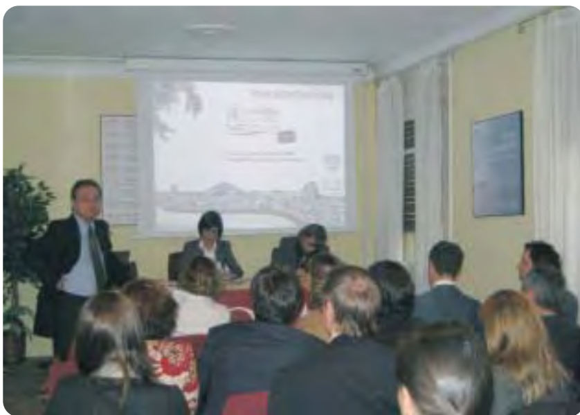
Imagen de la presentación del XII Congreso Nacional SEOM.