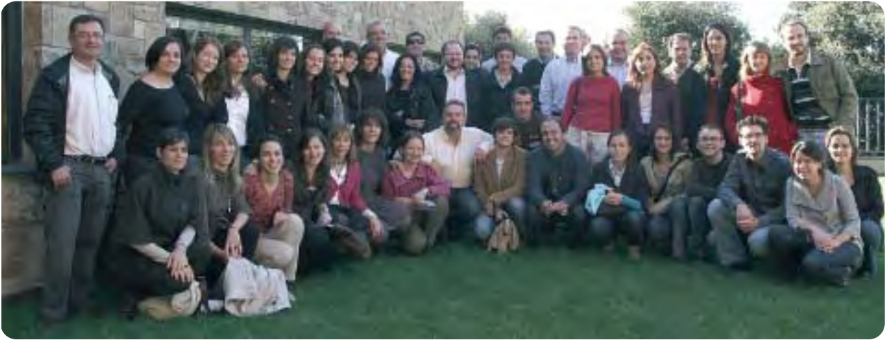
Imagen de los 31 residentes de toda España.