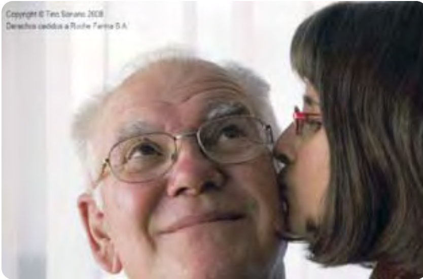
Una de las fotografías que se han mostrado en la exposición.

La Sociedad Española de Oncología Médica, con la colaboración de Roche, ha organizado, entre el 25 de noviembre y el 2 de diciembre, la exposición fotográfica “Airea Tus Esperanzas” cuyo autor es el fotógrafo Tino Soriano, premio World Press Photo 1999 y colaborador de National Geographic; y en la que pacientes de cáncer de pulmón han sido los protagonistas. Esta exposición ha podido ser visitada en la sede de la Organización Médica Colegial (OMC).