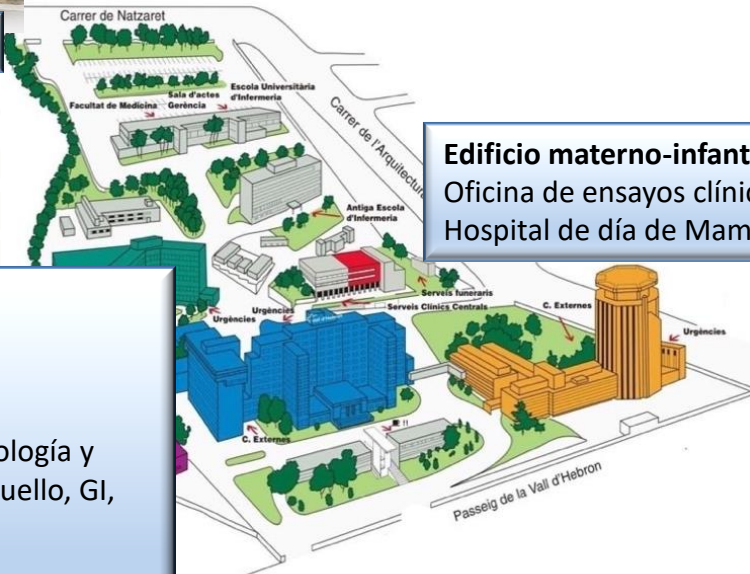
Edificio materno-infantil Oficina de ensayos clínicos, CCEE Oncología y Hospital de día de Mama, Ginecología y Melanoma