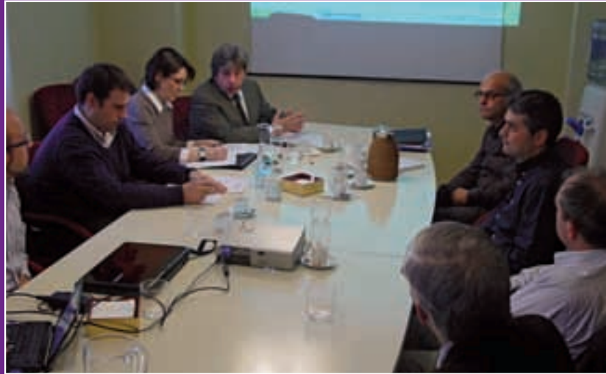
Una reunión del Grupo Cooperativo de Tumores de Cabeza y Cuello (TTCC) en la sede de SEOM

La Sociedad Española de Oncología Médica se complace en prestar este servicio a los socios.