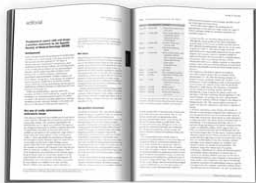
Annals of Oncology 21: 195–198, 2010

Este posicionamiento ha sido enviado a la revista científica Annals of Oncology , donde será publicado en 2010. ■