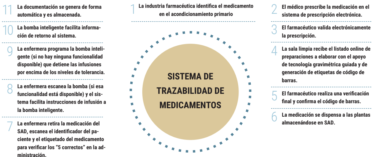
Figura 2. Sistema de Trazabilidad de Medicamentos.

Para poder llevar a cabo este sistema de trazabilidad en los hospitales, es indispensable que la industria farmacéutica realice la identificación de la unidad mínima que acaba llegando al paciente. Actualmente, la inclusión de un identificador único en el acondicionamiento primario es un hecho minoritario, lo que obligaría a los Servicios de Farmacia Hospitalaria (SFH) a disponer de tecnología para el reenvasado de múltiples formas farmacéuticas como comprimidos, ampollas o viales. En la figura 2 se detalla las etapas de un sistema de trazabilidad de medicamentos en los hospitales.